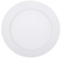
90 Blanco Técnico / Technical White / Blanc Technique