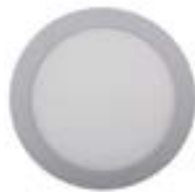
04 Aluminio / Aluminium / Aluminium