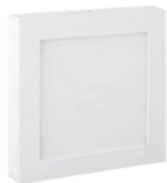
90 Blanco Técnico / Technical White / Blanc Technique