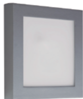
04 Aluminio / Aluminium / Aluminium