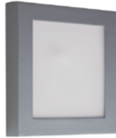
04 Aluminio / Aluminium / Aluminium