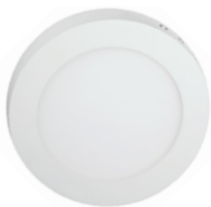
90 Blanco Técnico / Technical White / Blanc Technique