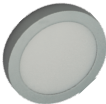
04 Aluminio / Aluminium / Aluminium