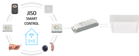
JISO Smart Control