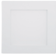
90 Blanco Técnico / Technical White / Blanc Technique