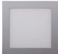
04 Aluminio / Aluminium / Aluminium