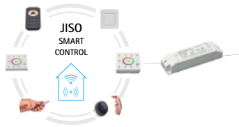
JISO Smart Control