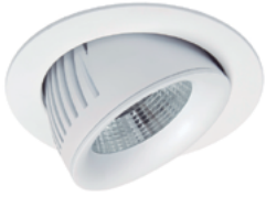
90 Blanco Técnico / Technical White / Blanc Techniqué