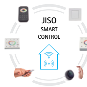
JISO Smart Control