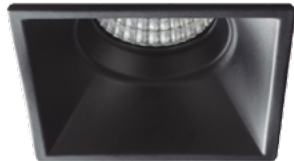
01 Negro / Black / Noir