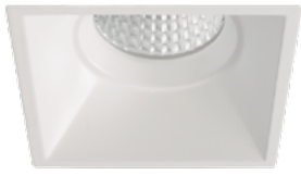
90 Blanco Técnico / Technical White / Blanc Technique