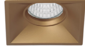
09 Oro Técnico / Technical Golden Or Technique