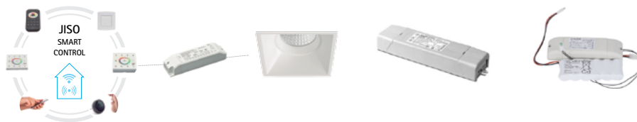
JISO Smart Control