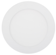
90 Blanco Técnico / Technical White / Blanc Technique