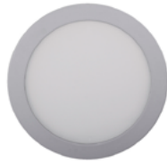
04 Aluminio / Aluminium / Aluminium