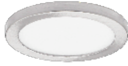
12 Níquel Satinado / Brus. Nickel / Níquel Satiné