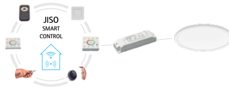
JISO Smart Control