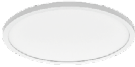
90 Blanco Técnico / Technical White / Blanc Technique