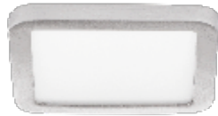
12 Níquel Satinado / Bros. Nickel / Niquel Satiné