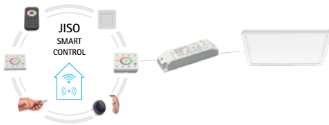
JISO Smart Control